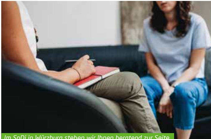
Im SpDi in Würzburg stehen wir Ihnen beratend zur Seite.