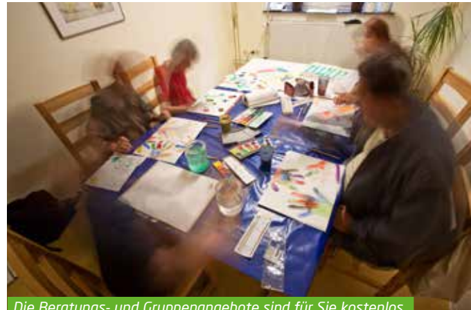
Die Beratungs- und Gruppenangebote sind für Sie kostenlos.