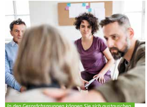
In den Gesprächsgruppen können Sie sich austauschen.